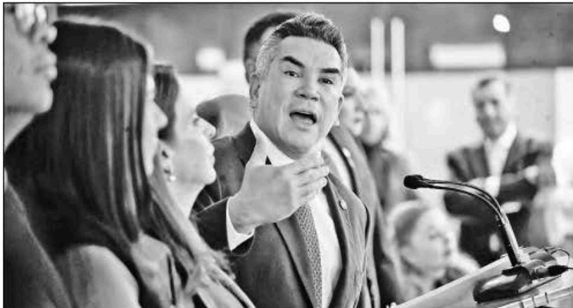
▲ El senador y dirigente del PRI, Alejandro Moreno Cárdenas, exigió a la Suprema Corte acelerar el proceso para discutir la

Facebook, TikTok, Twitter: galvanochoa Correo: galvanochoa@gmail.com