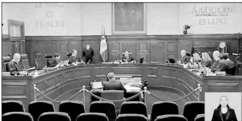
▲ Los ministros Norma Piña, Margarita Ríos Farjat, Jorge Pardo Rebollo, Alfredo Gutiérrez Ortiz Mena, Alberto Pérez Dayán, Juan Luis

X: @cafevega Correo: cfvmexico_sa@hotmail.com