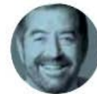
JUAN RAMÓN DE LA FUENTE

› Nos cuentan que Pedro Kumamoto anda sembrando el rumor de que será integrado al gobierno de la presidenta Claudia Sheinbaum , y que sería titular del Instituto de la Juventud. Y es que, tras perder la elección a la alcaldía de Zapopan y el registro de su partido Futuro, el joven político anda buscando colarse a la nómina de la 4T.