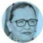
ROSA ICELA RODRÍGUEZ