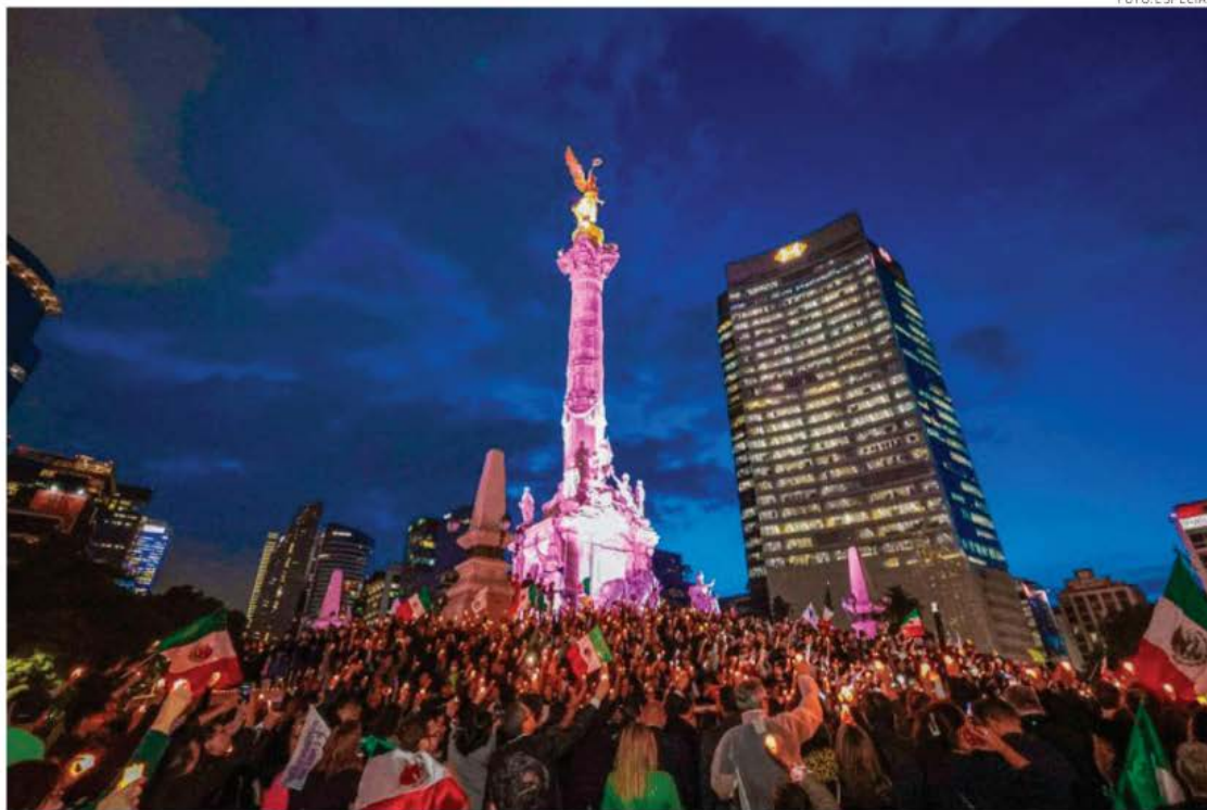
Trabajadores del Poder Judicial, acudieron al Ángel de la Independencia a manifestarse.

Los procesos de cambio son lentos y tiene un ciclo que hay que atender. El impulso de la carrera judicial se inició en 1994 y en treinta años evolucionó de tal manera que hoy en día es una realidad y existe el convencimiento entre los trabajadores del Poder Judicial de la Federación, que el mérito es la vía para ingresar y ascender en los juzgados y tribunales. El estudio y el trabajo son valorados y, generalmente, recompensados. Las acusaciones de corrupción gene-