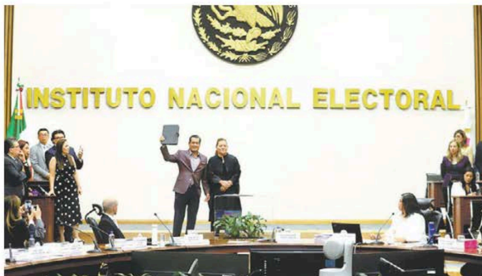
Sesión en la que fue avalado el reparto de plurinominales. JESÚS QUINTANAR

La eliminación de los órganos autónomos y la afectación al Poder Judicial son suficientes para hablar de un nuevo sistema político sin real división de poderes