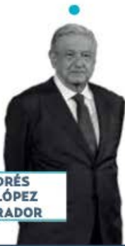
ANDRÉS M. LÓPEZ OBRADOR

► Balance del estado de la nación y una despedida emitirá el presidente López Obrador este domingo, 1 de septiembre, en el Zócalo capitalino. Será su sexto y último Informe de Gobierno, en el que no sólo difundirá los logros de su administración, sino que también contempla un mensaje de agradecimiento a los mexicanos. El acto inicia a las 11:00 horas y habrá invitados especiales; la principal, por supuesto, es la presidenta electa, Claudia Sheinbaum .