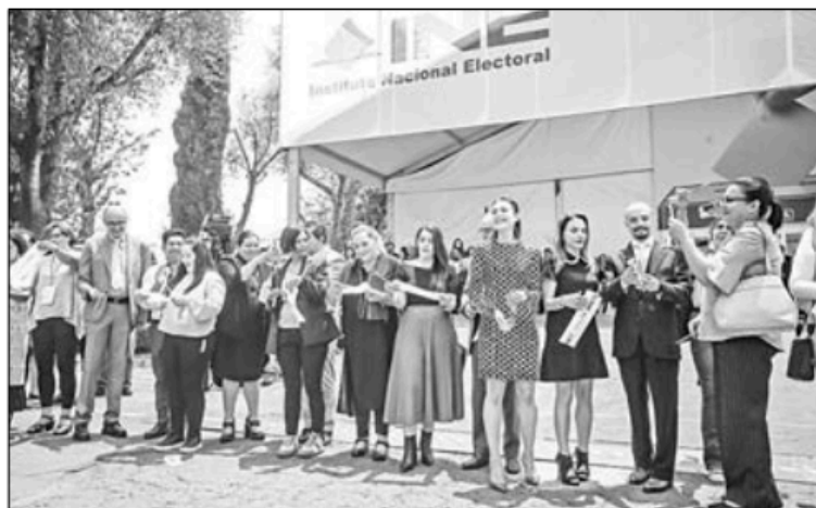
▲ El instituto Nacional Electoral inauguró ayer la macrosala de prensa desde donde se