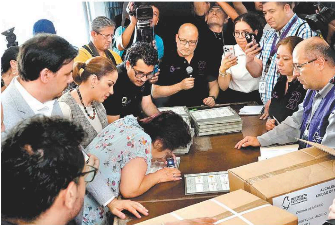
El proceso permite a la sociedad sentir afinidad y responsabilidad.

Y a es común que cuando se acercan las elecciones, algunos líderes de opinión hagan público el sentido de su voto y las razones en las que lo fundamentan. Están, desde luego, en toda la libertad de hacerlo, y sus disquisiciones pueden incluso ser útiles para alguien que estuviera indeciso —a estas alturas— sobre a quién depositarle la confianza de un cargo público este domingo.