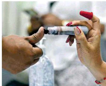
Instalarán más de 20 mil casillas electorales

El consejero electoral dijo que, a pesar de los problemas suscitados en diversos