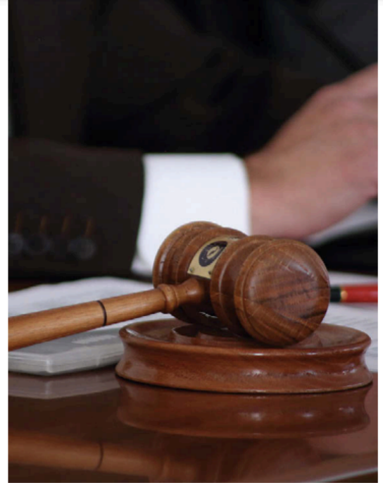
Los mexiquenses tendrán que definir a través de su voto a 73 personas de los mencionados espacios en disputa.

Para el caso de los servidores públicos y para que haya imparcialidad en estas campañas inéditas, también hay una serie de restricciones para ellos; por ejemplo, no podrán hacer proselitismo en favor de algún candidato así co-