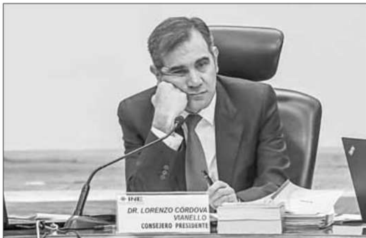
▲ El presidente del Consejo General del INE, Lorenzo Córdova Vianello, antes del inicio de

NO ES ALENTADORA para la oposición al obradorismo la nueva conformación de una de las dos áreas del poder electoral (la otra es el Tribunal Electoral del Poder Judicial de la Federación, donde también se requieren sacudimientos en serio). Por ello es que con toda oportunidad, el lorencismo ha tratado de instalar la versión del caos, del fraude inminente, del colapso de una presunta torre de virtudes autoproclamadas. ¡Adiós al ciclo encabezado (uf) por Lorenzo, Ciro y Edmundo! ¡Hasta el próximo lunes!