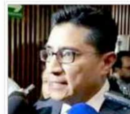
Rechazó Jesús George que con la salida de Lorenzo Córdova del INE se pretenda iniciar una "cacería de brujas"

Con la construcción de las nuevas oficinas, el SMSEM busca continuar fortaleciendo su presencia y ofreciendo un servicio de calidad a los maestros y maestras del Estado de México.