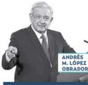
ANDRÉS M. LÓPEZ OBRADOR

» Por primera vez en todo su sexenio el presidente López Obrador no emitirá un informe de gobierno este 1 de diciembre, al cumplir un nuevo año, el quinto, al frente del gobierno mexicano. En su lugar, el mandatario inaugurará el aeropuerto de Tulum, Quintana Roo, y ahí dará “nada más unas palabras”, pero incluirá un balance de su gestión. Al evento han sido invitados empresarios y gobernadores, así como los integrantes de su su gabinete.