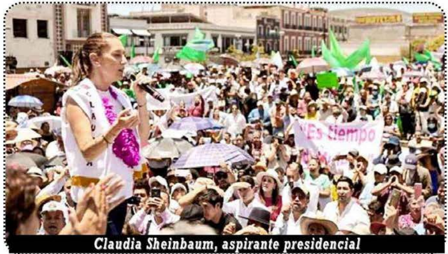
Claudia Sheinbaum, aspirante presidencial

En la disputa por la Presidencia de la República participan Claudia Sheinbaum Pardo , abanderada de Morena, Partido del Trabajo (PT) y Verde Ecologista de México (PVEM); Xóchitl Gálvez lo hará con el apoyo del Frente Amplio por México, integrado por los partidos Acción Nacional (PAN), Revolucionario Institucional (PRI) y de la Revolución Democrática (PRD); y Samuel García , postulado por el partido Movimiento Ciudadano (MC). Fueron los primeros en iniciar las precampañas políticas; posteriormente se sumarán los candidatos a diputados federales y senadores y, finalmente, los aspirantes a diputados locales, a