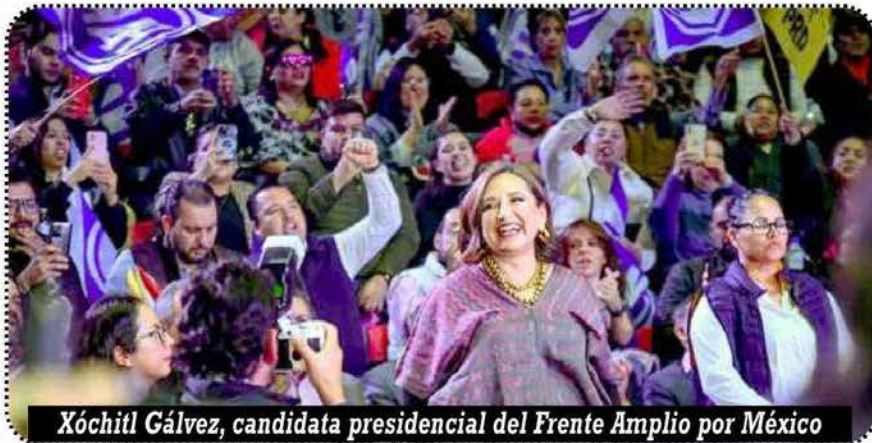
Xóchitl Gálvez, candidata presidencial del Frente Amplio por México

Un gobierno diferente no se construye con figuras o políticos que no sienten el dolor de la gente o con precandidatos que juegan a la "democracia" para ocultar su objetivo único: montarse en la silla presidencial. Hoy urgen hombres y mujeres con una visión de futuro diferente y que trabajen para que el pueblo se eduque, se una y de su organización política emerjan ciudadanos con un perfil y una visión que ponga al pueblo mexicano encima de todo. Por el momento, querido lector, es todo.