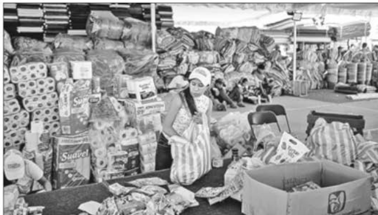
▲ Centro de recolección en Acapulco para repartir ayuda a los damnificados por el