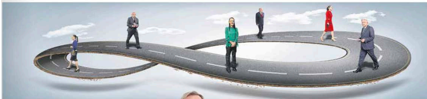
FOTOMATE ESMEBALDA ORDAZ

M e gustaría que se detenga por un momento y analice lo que significa que en México llevemos más de seis años de campaña ininterrumpida. Millones de mexicanos pensábamos que la retórica, las promesas y las acciones que caracterizan a una campaña política, llegarían a su final el pasado primero de julio de 2018 cuando López Obrador —después de tantos años— finalmente consiguió su objetivo de portar la banda presidencial. Sin embargo, esto no sucedió. No sólo la campaña continuó, sino que realmente a estas alturas es incierto si verdaderamente se efectuó el ejercicio de gobernar.