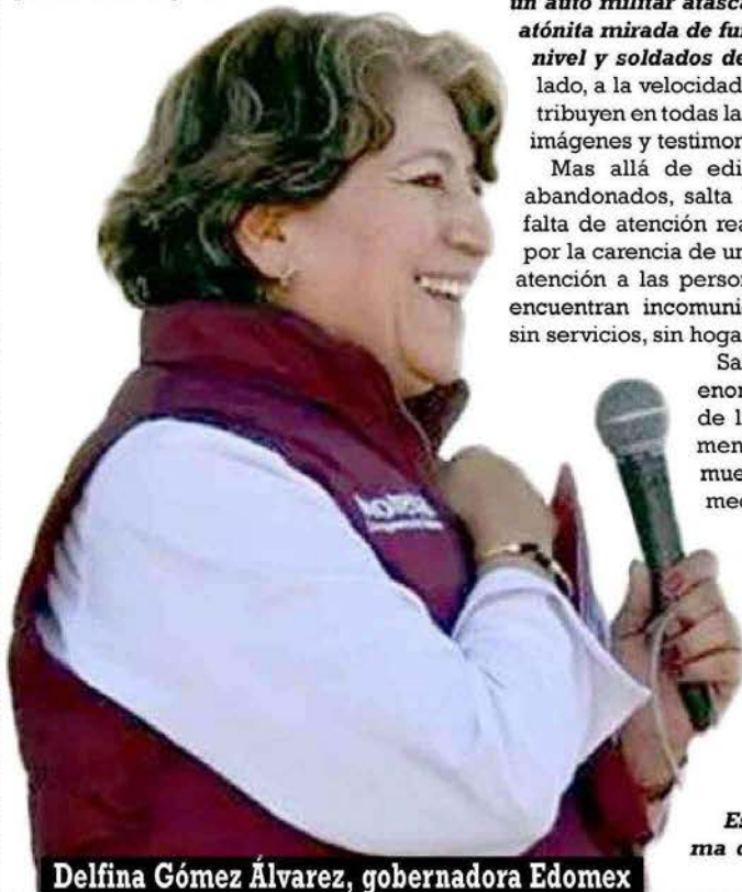
Delfina Gómez Álvarez, gobernadora Edomex