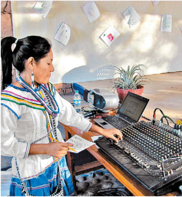
La cifra, similar a la que sí paga impuestos.