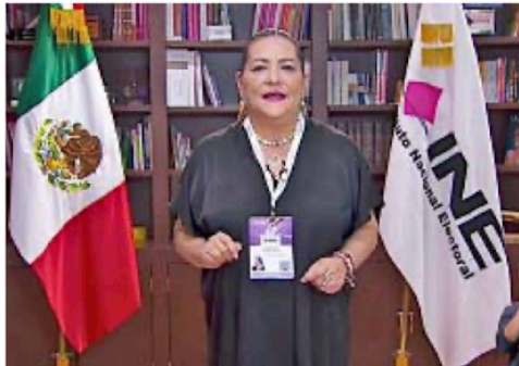
La consejera presidenta del INE, Guadalupe Taddei, retrasó en más de una hora los resultados del conteo el 2 de junio.

En su informe final, el Comité de Expertos en estadística y matemáticas, encargado de elaborar la tendencia, advirtió que el INE debe corregir varios aspectos del proceso, por lo que entregó al organismo una veintena de recomendaciones.