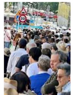
Miles de mexicanos se quedaron sin poder votar en el extranjero.

El 25.12 por ciento eligió participar mediante voto postal, el 7 por ciento quedó registrado para votar presencialmente en 23 sedes consulares de México que fueron habilitadas y el 678 por ciento se inscribió bajo la modalidad de voto electrónico por internet.