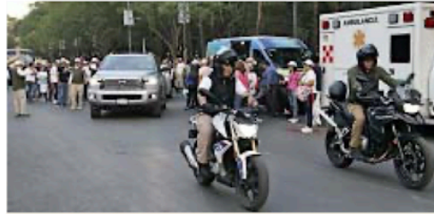
Las candidatas y el candidato a la Presidencia tuvieron protección por parte de elementos del Ejército.

En muchos casos se registraron nombres para cumplir con la entrega de listas, pero después fueron sustituidas por personas cercanas a las cúpulas.