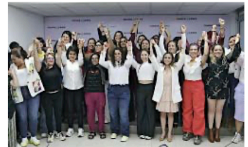
Consejeras electorales advirtieron que se deben reforzar los mecanismos contra la violencia política contra mujeres.

La medida cautelar decretada con mayor prevalencia, se estableció, fue ordenar el retiro de las publicaciones denunciadas en redes sociales, medios de comunicación o en plataformas de medios digitales.