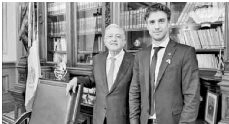
▲ El Presidente recibió ayer en Palacio a