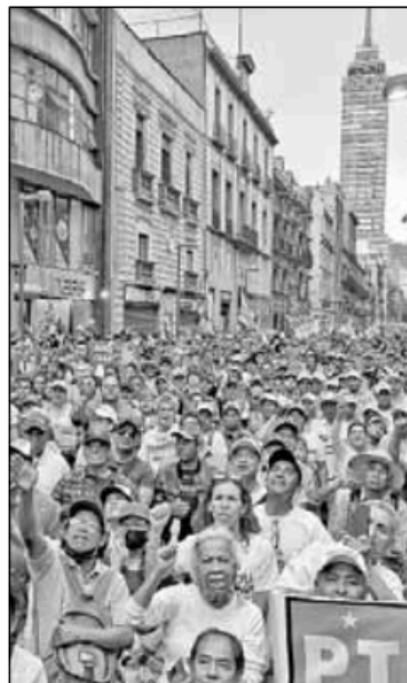
▲ Miles de seguidores atestaron ayer las vías aledañas al Zócalo capitalino para asistir al cierre de campaña de Claudia Sheinbaum, candidata a la Presidencia por la coalición Sigamos Haciendo Historia (Morena-PT-PVEM). La imagen, en la calle de Madero.