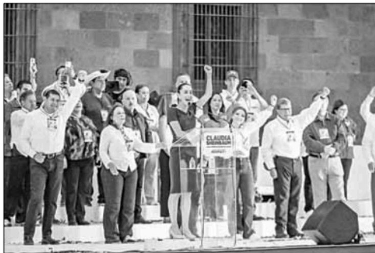
▲ Líderes y candidatos locales de Morena acompañaron ayer a Claudia Sheinbaum en

Y, MIENTRAS EN esta columna se analiza mañana el cierre de campaña de Claudia Sheinbaum en la Plaza de la Constitución, ¡hasta mañana!