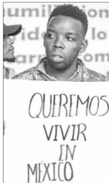
▲ Los migrantes aseguran que no buscan llegar a EU, sino obtener las tarjetas de visitantes por razones humanitarias para quedarse a trabajar y hacer su vida en nuestro país ante la escalada de violencia tras la pandemia y el asesinato del presidente de la isla en 2021.