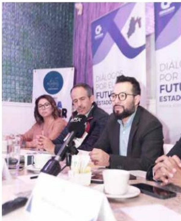
Canirac busca incentivar la participación ciudadana en la elección.