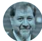
GERARDO FERNÁNDEZ NOROÑA

En el Infonavit, al mando de Octavio Romero Oropeza , siguen limpiando la casa . Luego del coyotaje de despachos de abogados exhibidos y de los casos de corrupción denunciados por la actual administración, varios ex titulares de ese organismo están muy nerviosos, por los trapitos sucios que se les pueda encontrar.