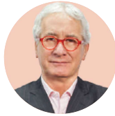
POR JAVIER SOLÓRZANO ZINSER