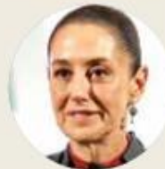
● Claudia Sheinbaum Pardo

Ante las bravatas acentuadas, la sobriedad reiterada. Frente a la segunda amenaza del gobierno de Estados Unidos de imponer exorbitantes aranceles a México a partir del sábado (la primera fue a través de una no muy clara orden ejecutiva de Trump la semana pasada, la segunda la disparó el martes la vocera de la Casa Blanca con la vulgaridad con que se esparce un chisme: tengo entendido que va a ocurrir, que los mexicanos se van a joder), la presidenta