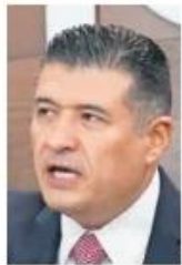
Adrián Alcalá Méndez

:::: Ayer el presidente del Instituto Nacional de Acceso a la Información, Adrián Alcalá , en representación del pleno del Inai, leyó un comunicado en el que reprobó los presuntos actos de corrupción por los que han sido señalados funcionarios de ese instituto, y pidió