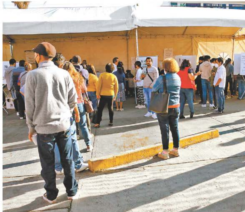
Hidalguenses hacen fila para emitir su voto.

Lo que ello implica, es que una de las variables que más podría incidir en generar resultados distintos a los esperables con base en resultados electorales recientes, así como en sondeos de opinión es, justamente, la de la tasa de participación en las elecciones del próximo año. En concreto, considerando que el electorado que se abstiene tiende a ser joven, y contar con más ingreso y más escolaridad que el votante promedio, y ese perfil de votantes ha sido el más denostado y que ha experimentado más costos durante el gobierno de López Obrador, es probable que un aumento de su participación