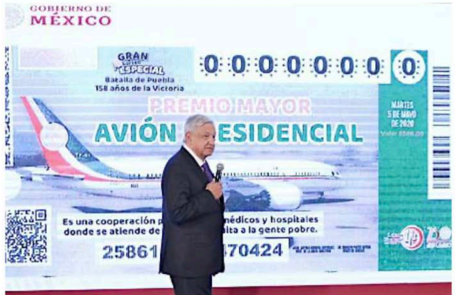
LARIFA. Luego de más de un año de intentar vender el avión presidencial, el 17 de febrero de 2020 se dio a conocer que sería rifado. Al final sólo se ofreció como premio su equivalente en dinero.

En la pandemia, se negó a implementar programas de apoyo para las empresas. Aprovechó el foro de las conferencias para advertir que "no habría rescate" y presumir que, pese a ello, nunca se cayó la recaudación de impuestos.