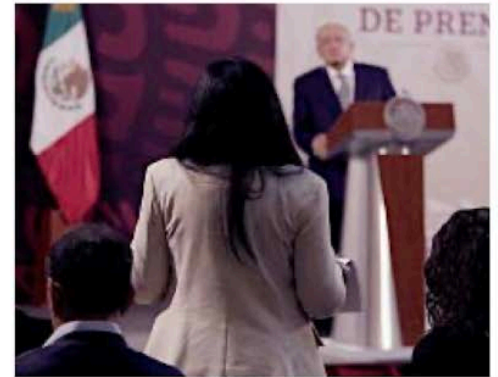
DUDAS. Algunos de los acreditados en las mañaneras estuvieron bajo sospecha de hacer preguntas a cambio de dinero.

Grupo REFORMA tuvo acceso a una conversación vía WhatsApp, en la que una YouTuber ofreció un pago de