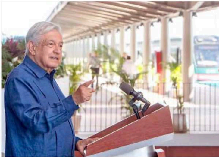
DE GIRA. El Presidente realizó una de las conferencias en la Estación Palenque del Tren Maya, en febrero pasado.

Apenas en mayo, AMLO adelantó que, aunque tiene contemplado cerrar sus redes sociales como parte de su retiro de la vida pública, mantendrá en la plataforma de YouTube los videos de sus conferencias. ■