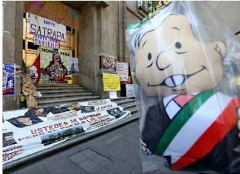
PROTESTAS. Frente a la Corte, manifestantes expresaron su rechazo a los Ministros.

El 20 de agosto pasado, retó a los cinco empresarios más ricos del País Carlos Slim, Germán Larrea, Ricardo Salinas Pliego, Alejandro Baillères y María Asunción Aramburuzabala a pronunciarse públicamente sobre la reforma judicial. ■