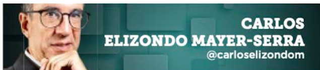
CARLOS ELIZONDO MAYER-SERRA @carloselizondom

El éxito político de AMLO está montado sobre un raquíto crecimiento y obras de poca utilidad.