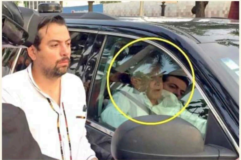
A DISTANCIA. Luego de que la CNTE, en Chiapas, le impidió el paso en agosto de 2021, AMLO dio su conferencia por vía telefónica.

Estuvo a punto de quebrarse cuando recordó la difícil infancia por la que atravesaron sus hijos, debido a la persecución de la que, dijo, fue objeto en el Gobierno de Ernesto Zedillo y de Roberto Madrazo, en Tabasco.