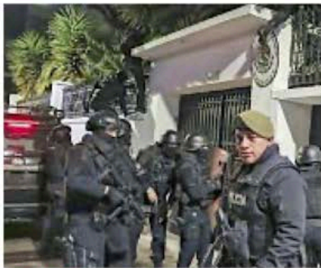
CRISIS. Fuerzas ecuatorianas irrumpieron en la Embajada mexicana.