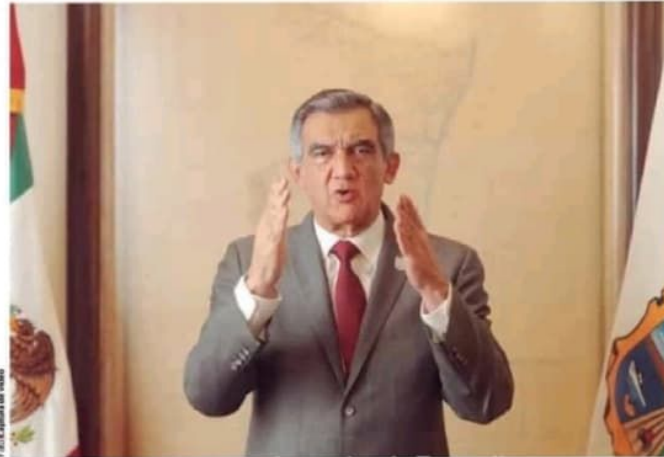
EL MANDATARIO electo, en un videomensaje compartido en sus redes sociales, ayer.

LA VERDAD es una sola. El pueblo de Tamaulipas me eligió su gobernador. Las y los tamaulipecos quieren un cambio y respaldan la Cuarta Transformación, a partir del primero de octubre se abre una nueva etapa de futuro y esperanza"