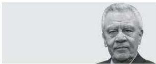
Lic. Jesús Ramírez Cuevas, Vocero de Presidencia:

Ahora que el presidente anda con la idea de que se investiguen las empresas de Xóchitl Gálvez , le sugiero que le den ficha de atención a su caso y primero nos informen sobre el avance de otros asuntos vinculados a la 4T, que vienen de tiempo atrás y son bastante graves.