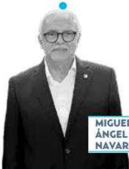
MIGUEL ÁNGEL NAVARRO

› Servicios de calidad mundial en materia de salud comprometió el gobernador de Nayarit, Miguel Ángel Navarro , ante el presidente López Obrador . En la visita que el mandatario federal realizó a la entidad, su anfitrión le pidió despreocuparse, porque “a fin de año habremos de tener servicios comparados con los mejores del mundo, yo se lo afirmo”. Es decir, la entidad nayarita sería algo así como Copenhague, la capital danesa.