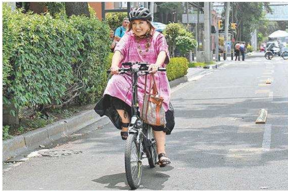
Xóchitl Gálvez, precandidata de la oposición a la Presidencia. JUAN CARLOS BAUTISTA

¿Quién no quisiera promover una opción en tal modo atractiva y familiar que se identificara con no más que una letra?