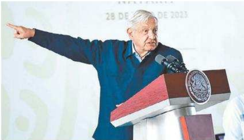
En la elección de 2018 favoreció a López Obrador. JUAN CARLOS BAUTISTA