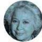
OLGA SÁNCHEZ CORDERO