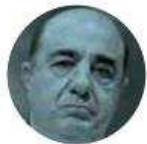
JESÚS MURILLO KARAM

› Servicios de calidad mundial en materia de salud comprometió el gobernador de Nayarit, Miguel Ángel Navarro , ante el presidente López Obrador . En la visita que el mandatario federal realizó a la entidad, su anfitrión le pidió despreocuparse, porque “a fin de año habremos de tener servicios comparados con los mejores del mundo, yo se lo afirmo”. Es decir, la entidad nayarita sería algo así como Copenhague, la capital danesa.