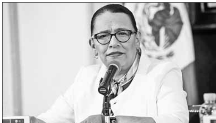
▲ Se refuerza la estrategia de protección a mujeres y niñas, afirma la titular de la