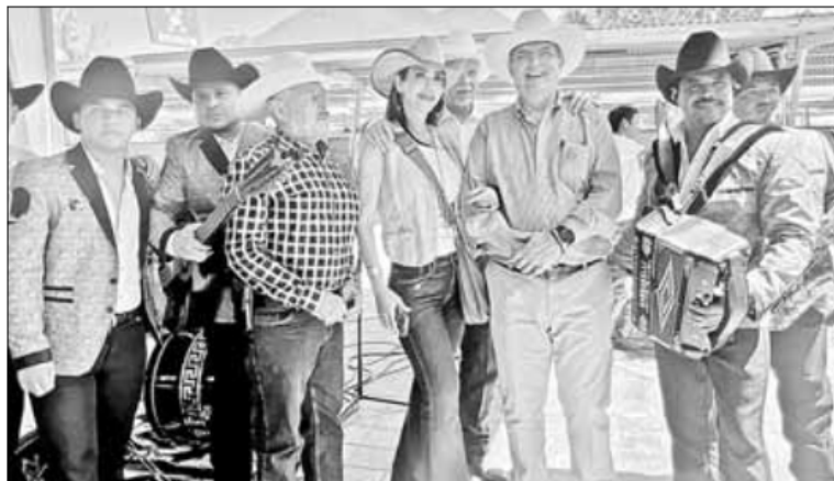
▲ El ex canciller presentó la lista de gastos de su gira por la coordinación de la defensa