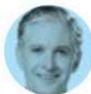
ALFREDO DEL MAZO

» Nos hacen ver que la declinación de la senadora Lilly Téllez a inscribirse al proceso de selección del candidato presidencial de Va por México, le asegura una buena posición en la repartición de candidaturas. En principio podría reelegirse como senadora, pero también ir como plurinominal a la Cámara de Diputados.