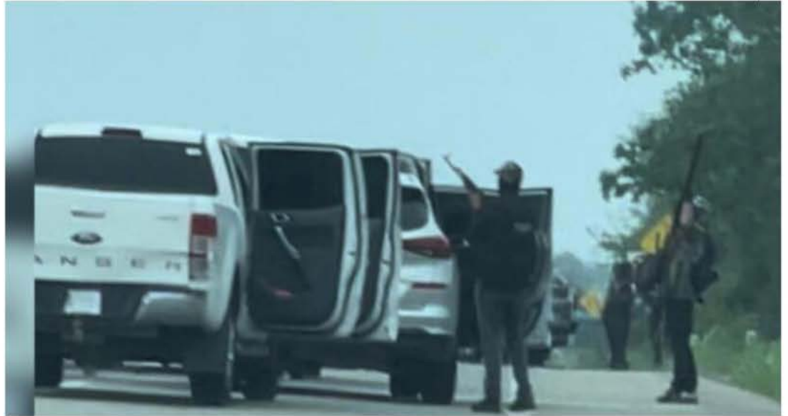
En Chiapas secuestran a 14 trabajadores de Seguridad Pública.

Mientras tanto, nuestro país está en llamas. La alcaldesa de Tijuana, Monserrat Caballero, se mudó con su fami-