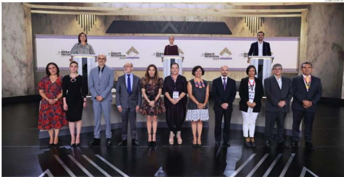
Xóchitl Gálvez, Claudia Sheinbaum y Jorge Álvarez Máynez, junto con los consejeros electorales previo al segundo debate presidencial.

La candidata de Morena dijo, entre otras cosas, que el Aeropuerto Felipe Ángeles está lleno (i), que los precios de las gasolinas no han aumentado, que en la CdMx no hubo reconstrucción de viviendas después del terremoto de 2017. Hay