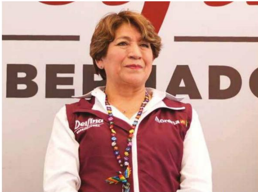
Delfina Gómez candidata a gobernadora del Estado de México por MORENA, PT y PVEM.

Tras recibir ovaciones, la maestra Delfina Gómez se dirigió a la población que se dio cita para aclarar que los programas sociales y apoyos, no desaparecerán y que al contrario, serán universales