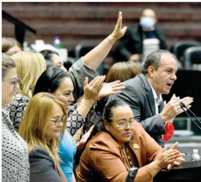
CUAUHTÉMOC BLANCO, diputado de Morena, respaldado por legisladoras de su partido, en el Pleno de San Lázaro, el martes.

Y así, con 291 votos (40 más de los requeridos) Morena, el PVEM y el PRI