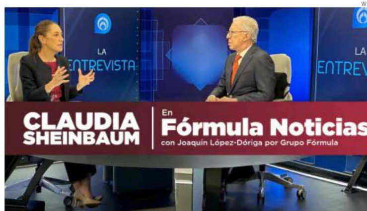
Claudia Sheinbaum fue entrevistada por López Dóriga.

López-Dóriga agregó que la doctora Sheinbaum ha dicho que construirá “el segundo piso de la cuarta transformación” pero que el primero no está construido por completo, que hay baches, agujeros y obras pendientes. Tranquila-