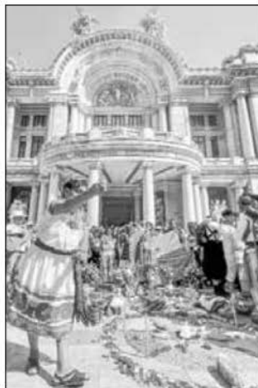
▲ Tras una ceremonia tradicional realizada en la explanada del Palacio de Bellas Artes, se abrieron las puertas para recibir a los gobernadores y representantes de 181 de 194 etnias del país, quienes acudieron a la instalación formal del Consejo Nacional de Pueblos Indígenas, con el cual se les reconoce como sujetos de derecho y no objetos de interés político o sólo exponentes de una expresión cultural.