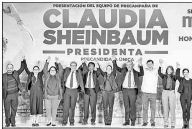
▲ La precandidata única de Morena presentó ayer a quienes la "llevarán al triunfo" y la

Facebook, Twitter: galvanochoa Correo: galvanochoa@gmail.com