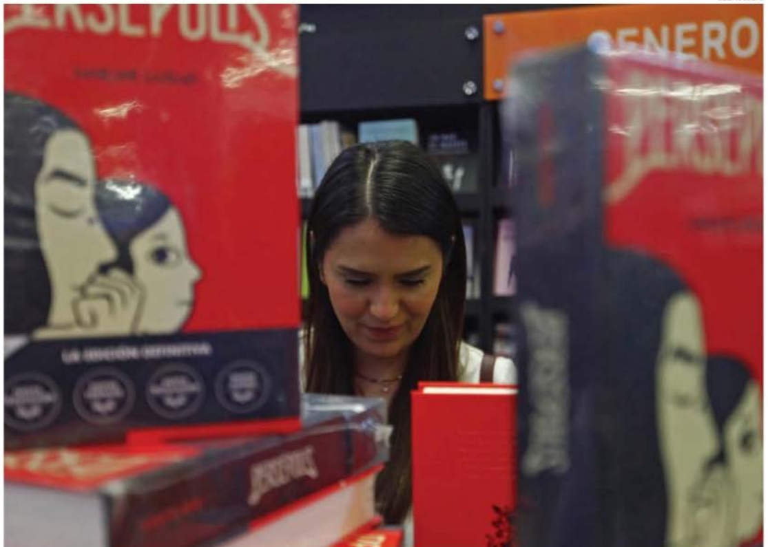
Este año, la Unión Europea es el invitado de honor en la Feria Internacional del Libro de Guadalajara.

En ese sentido, poco importa que la de este año sea la edición número 36 de la Feria, o que uno de los stands más grandes sea el del Fondo de Cultura Económica, que dirige Paco Ignacio Taibo. Lo que importa es que allí, de