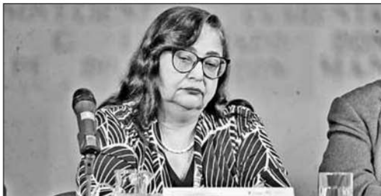
▲ En cuestión de días el “compromiso” y la “solidaridad” de la presidenta de la Suprema Corte, Norma Piña, no trascendió el discurso público, pues se conoció que operó para

Twitter: @cafevega cfvmexico_sa@hotmail.com