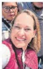
TOMADA DE X