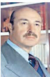
CRÉDITO DE FOTO

::::: Ayer se celebró y casi pasó desapercibido el aniversario 101 del natalicio de Jorge Jiménez