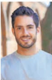
CRÉDITO DE FOTO

::::: Dice El dirigente estatal del Partido Verde, José Couttolenc , que en todo el país existen 64 millones de baches, de los cua-