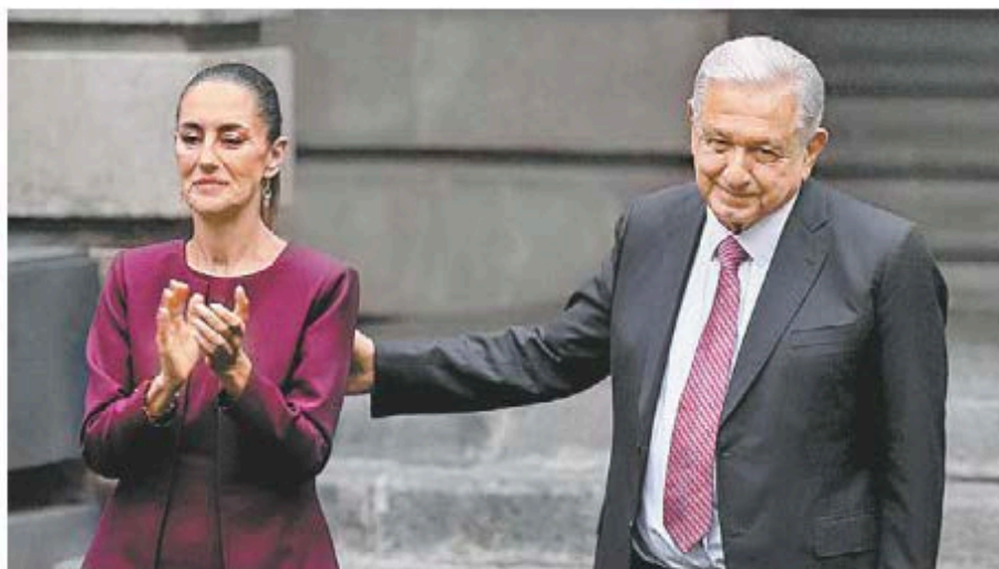
La presidenta electa y el mandatario saliente. OCTAVIO HOYOS