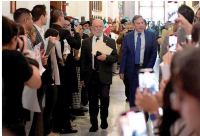
LOS MINISTROS Juan Luis González Alcántara Carrancá y Javier Láynez, ayer, en la SCJN, durante la manifestación de trabajadores del Poder Judicial.

La ministra presidenta de la Suprema Corte de Justicia de la Nación (SCJN), Norma Piña, admitió a trámite un recurso para que el pleno del alto tribunal se pronuncie sobre los criterios para la asignación de diputaciones y senadurías por la vía plurinominal. El ministro Juan Luis González Alcántara Carrancá, a quien le fue turnado el proyecto, dijo que la decisión del máximo tribunal en el tema de sobre-representación no reemplazará decisión