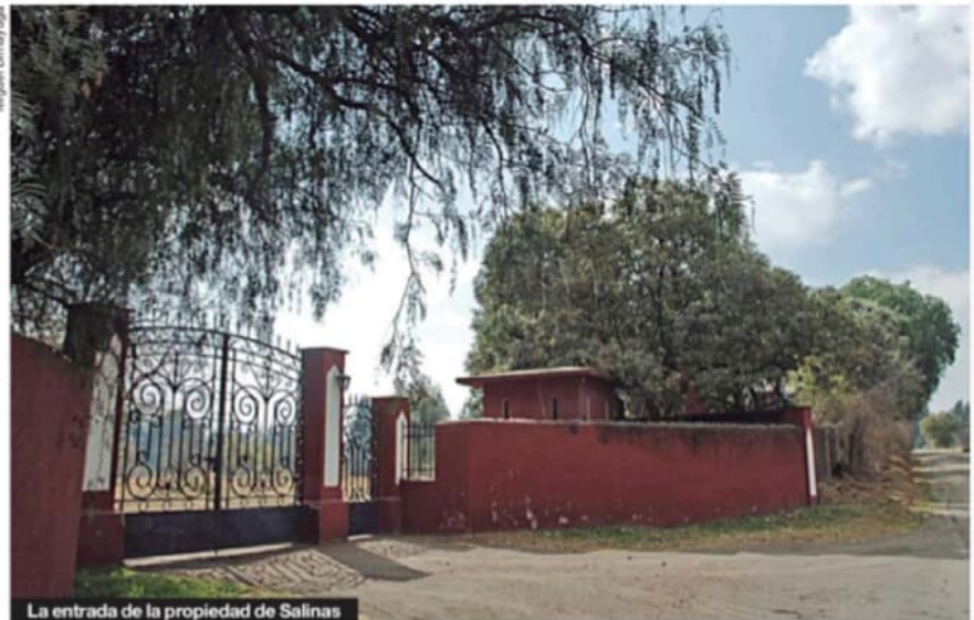
La entrada de la propiedad de Salinas

El 24 de marzo pasado trascendió un oficio firmado por Salinas de Gortari, en el cual anuncia que donará una de sus parcelas al alcalde de Chiautzingo Salvador Domínguez, para que construya una nueva unidad deportiva en el ejido. Esto, aunque ya existen instalaciones de ese tipo en ▶