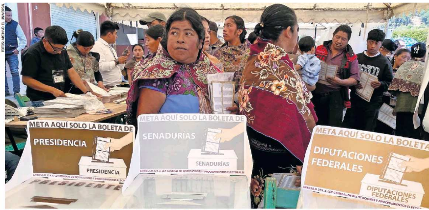
En las elecciones del 2 de junio de 2024 estuvieron en juego más de 20 mil cargos locales y la renovación de nueve gubernaturas; varios partidos participaron en coalición.

PARTIDOS de los seis registrados en Chiapas podrían perder su registro tras los comicios de 2024.