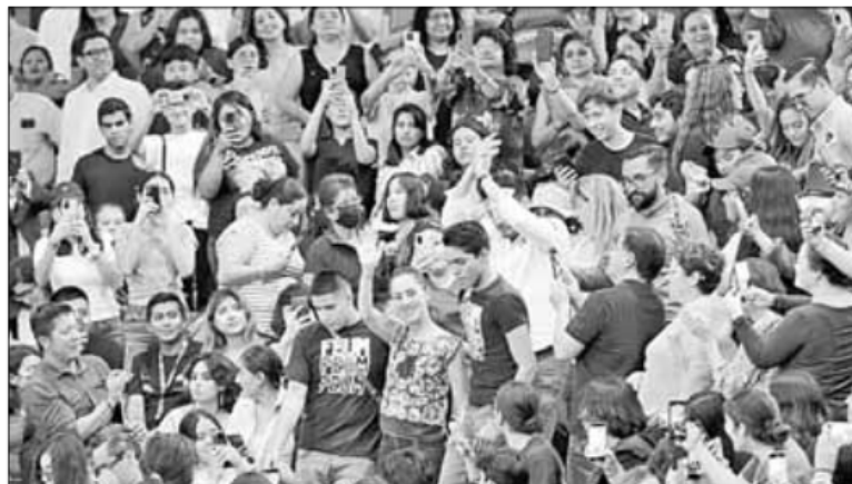
▲ “Todos los aspirantes presidenciales de la oposición defienden el proyecto de Claudio X.