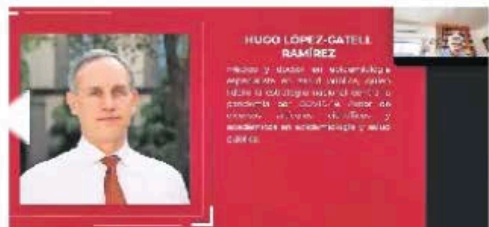
Sesión del Consejo Nacional de Morena

:::: Nos platican que la noche de ayer el Consejo Nacional de Morena sesionó para nombrar a las y los integrantes de una comisión que participará activamente en la construcción del proyecto de nación 2024-2030 de Morena, al cual deberá apegarse el candidato o candidata del partido oficial a la Presidencia de la República. Se trata de 21 personas, entre las que destaca el subsecretario de Salud, Hugo López-Gatell , y quienes tendrán la tarea de recolectar las conclusiones de los foros distritales y locales que realizará el partido. ¿Será que entre sus labores con el partido al subsecretario le quede algún tiempcito para atender su responsabilidad principal en materia de salud y colocar a México al nivel de Dinamarca en materia sanitaria?