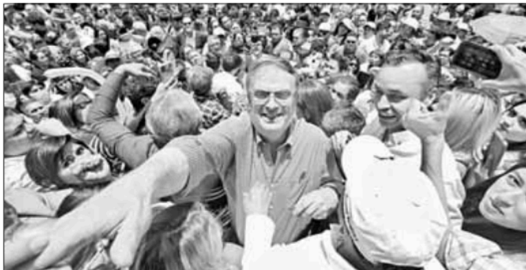
▲ El ex canciller Marcelo Ebrard visitó ayer el jardín Hidalgo, de Coyoacán, como parte de