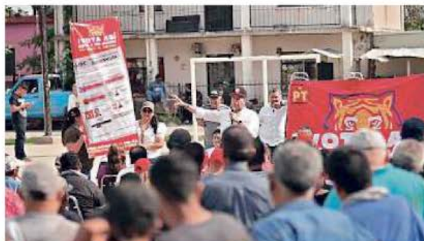
Ricardo Mejía dejó Morena, y su cargo en la 4T, para postularse por el PT.