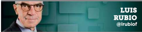
LUIS RUBIO @lrubiof

Justo cuando los gobiernos buscan consolidar lo hecho para una sucesión tranquila, AMLO dobla las apuestas y abre nuevos frentes.