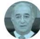
ALBERTO PÉREZ DAYÁN

› Nos adelantan que Claudia Ruiz Massieu será una de las integrantes de la Comisión Permanente, de lado de la bancada de Movimiento Ciudadano. La expriista es candidata plurinominal del partido naranja a la Cámara de Diputados, por lo que su inclusión en la permanente es una especie de ensayo, antes de su mudanza a San Lázaro.