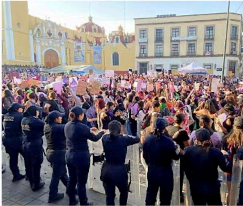
La Plaza Lerdo, en Xalapa, lució repleta durante la manifestación de mujeres, el pasado 8 de marzo, para protestar por la inseguridad y discriminación que sufren en el estado.

de la Política de Desarrollo Social (Coneval).