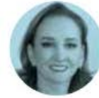
CLAUDIA RUIZ MASSIEU

› Nuevamente el gobernador de Jalisco, Enrique Alfaro , salió a decir que al terminar su gestión se retira de la política. Asegura que no será funcionario de ningún gobierno, embajador o cónsul, y rechazó acercamientos con Morena con ese fin. Tampoco es que lo hayan invitado; vaya, ni siquiera en su partido Movimiento Ciudadano.