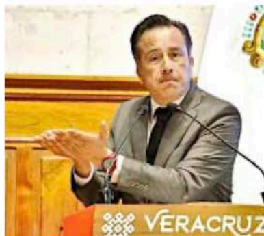
El Gobernador Cuitláhuac García ha tenido resultados contrastantes en seguridad.

En cuanto a mejoras sociales, la población en situación de pobreza se redujo de 2018 a 2022 de un 60.2 a 51.7 por ciento, pero la carencia en accesos a servicios de salud en el mismo lapso pasó de 31 a 49.2 por ciento, casi el triple, según el Consejo Nacional de Evaluación