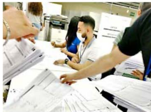
■ El PREP es uno de los mecanismos utilizados por las autoridades en la jornada electoral.

Existe un riesgo adicional: se prevé que, además de los 12 CR del INE, se realicen hasta 20 más, contratados por partidos políticos, empresas de TV y radio, diarios y gobiernos, federal y locales. Por ejemplo, si cada uno de esos 20 tiene una muestra de 1,500 casillas, habrá 13,740 personas del INE afuera de igual número de casillas, más otras 30 mil personas, en otras tantas casillas, para CR privados. Sabemos que el tamaño del conflicto postelectoral es inversamente proporcional a la diferencia porcentual entre el ganador y el segundo lugar de la elección presidencial. Pero en este año hay un factor adicional. Si el partido del gobierno no obtiene su meta de arrasar en las 3 elecciones federales, en las de Gobernador y en la CDMX, habrá conflicto. Bajo esa perspectiva, no veo qué gana el INE abriendo la puerta a un problema de confianza y oportunidad de los conteos rápidos. □