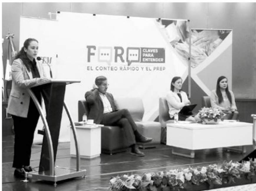
El PREP dota de estabilidad y confianza al proceso electoral.