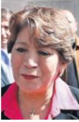
Delfina Gómez Álvarez.

:::: La reciente reunión encabezada por la gobernadora del Estado de México, Delfina Gómez Álvarez , con las fuerzas armadas en Donato Guerra, refleja un esfuerzo coordinado para combatir la delincuencia en la entidad. Durante este encuentro, se analizaron estrategias que han contribuido a la disminución de los índices delictivos y se reconoció la labor de las fuerzas armadas en materia de seguridad. La colaboración entre los tres órdenes de gobierno es fundamental, pero debe ir acompañada de transparencia y rendición de cuentas. Los mexiquenses esperan que estas iniciativas no solo queden en el discurso, sino que realmente contribuyan a mejorar la seguridad y el bienestar en el estado.