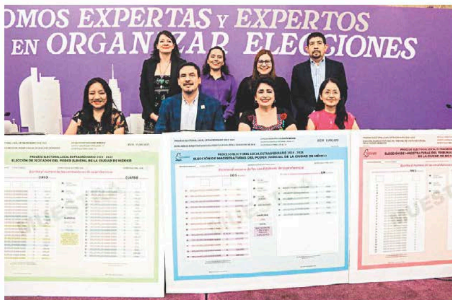
Las elecciones de jueces y ministros se harán sin la presencia de esos organismos.

Hay tres aspectos de la vida pública que parecen confirmar esto. El primero es la elección de jueces y ministros que se avecina este 1 de junio. No solo será la primera vez que la gente elija por voto directo a las personas juzgadoras, sino que se trata, hasta donde recordamos,