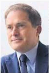
TOMADA DE X

::::: En la alcaldía Álvaro Obregón, nos dicen, ven que el proyecto del gobierno de la Ciudad de México para construir una Utopía en el Parque Águilas Japón ha sido aprovechado por grupos políticos para obtener un nuevo frente de batalla. Para evidenciarlo, el alcalde morenista Javier López Casarín fija hoy una postura, a fin de revelar las motivaciones partidistas de varios de los opositores a la obra, que busca replicar un modelo social exitoso que la jefa de Gobierno, Clara Brugada , estableció desde que lideraba Iztapalapa. ¿Cuál será la sorpresa ante los opositores al proyecto?