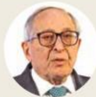
● David Kershenobich

que se levantó entre octubre de 2023 y mayo de 2024 no sirvió y se volverá a realizar. Así lo decidió el secretario de Salud, David Kershenobich , luego de recibir la investigación el pasado mes de octubre y percatarse de que los datos obtenidos no son congruentes con los estudios previos ni corresponden con la realidad". Ayer, también, con cuidado para no lastimar a nadie, la Secretaría de Salud confirmó que lleva a cabo un estudio sobre adicciones "en colaboración con el Instituto Nacional de Salud Pública y el Inegi", y que además "se está realizando un levantamiento exhaustivo de estudios clínicos y básicos en relación con las adicciones; los resultados de estos estudios se obtendrán este mismo año". Nada más que agregar.