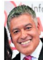
TOMAS DE X

Nos platican que alrededor de 3 mil trabajadores del organismo de agua, DIF y gobierno municipal de Coacalco podrían resultar afectados por un adeudo que asciende a 181 millones de pesos por concepto del pago de Impuesto Sobre la Renta (ISR), correspondiente a los ejercicios fiscales 2017, 2018, 2020 y