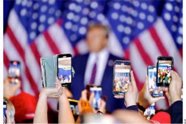
El ex Mandatario lidera las elecciones internas republicanas.

En la actual contienda por la nominación presidencial al interior del Partido Republicano, el equipo de Trump ha prometido traer de regreso el polémico programa migratorio “Quédate en México” así como reactivar las expulsiones sumarias de migrantes a México bajo el Título 42 de la Ley de Salud Pública.