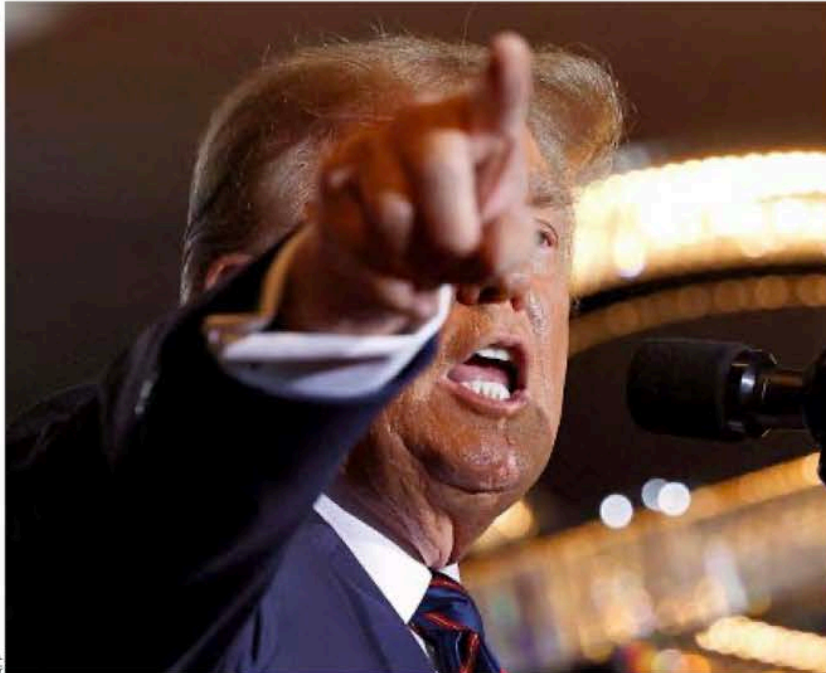
Trump aventaja al Presidente Biden en las encuestas recientes.

Utilizar la amenaza de no renovar el T-MEC no se-