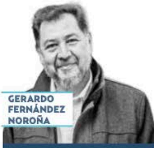
GERARDO FERNÁNDEZ NOROÑA

› Cerró filas la 4T en el Senado en torno a la presidenta Claudia Sheinbaum , ante la amenaza del presidente electo de EU, Donald Trump , de imponernos un arancel de 25% si no contiene la migración y el tráfico de fentanilo. El presidente de la Mesa Directiva, Gerardo Fernández Noroña , leyó un pronunciamiento de respaldo al llamado de la mandataria al estadounidense para “retirar cualquier amago de sanción económica” y fomentar el diálogo y los acuerdos binacionales.