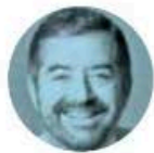
JUAN RAMÓN DE LA FUENTE

› Cerró filas la 4T en el Senado en torno a la presidenta Claudia Sheinbaum , ante la amenaza del presidente electo de EU, Donald Trump , de imponernos un arancel de 25% si no contiene la migración y el tráfico de fentanilo. El presidente de la Mesa Directiva, Gerardo Fernández Noroña , leyó un pronunciamiento de respaldo al llamado de la mandataria al estadounidense para “retirar cualquier amago de sanción económica” y fomentar el diálogo y los acuerdos binacionales.