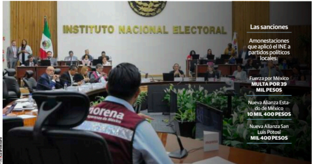
INTEGRANTES del Instituto Nacional Electoral durante una sesión ordinaria realizada el pasado mes de octubre.

2 De junio del próximo año serán las elecciones presidenciales