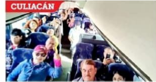
Los seguidores del Presidente López Obrador gritaron "¡Otra vez, otra vez, marchando con Andrés!".