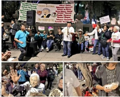
MADRUGADORES. Simpatizantes del Frente Nacional Obradorista arribaron a la tarde de ayer al Ángel de la Independencia para apartar un lugar en la marcha del Presidente.

"En Pemex no se respeta el trabajo", resumió. "Eso quiero decirle al Presidente".