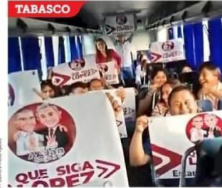
Con pancartas de apoyo al Secretario de Gobernación, Adán Augusto López, simpatizantes morenistas viajaron a la Ciudad de México.