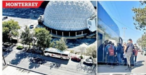
Los simpatizantes morenistas debieron pasar lista y recibieron pancartas para apoyar a la denominada Cuarta Transformación.

CON INFORMACIÓN DE JUAN CARLOS RODRÍGUEZ Y URIEL VÉLEZ