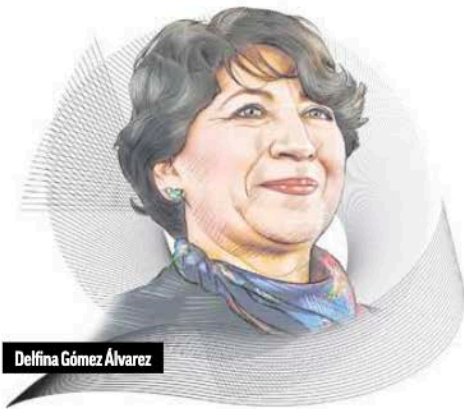
Delfina Gómez Álvarez

H a pasado un año rápidamente, luego de que la morenista Delfina Gómez Álvarez asumiera la gubernatura del Estado de México, la entidad federativa más poblada del país con 17.5 millones de personas; por el número de industrias instaladas en su territorio, pero también, hay que decirlo, por su cercanía con la Ciudad de México, que hace que tenga que trabajar de la mano con diversos jugadores y en diversos frentes.