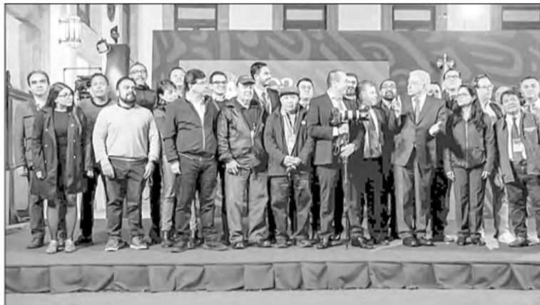
▲ Casi en el ocaso de su mandato, el Presidente agradeció en la mañanera de ayer