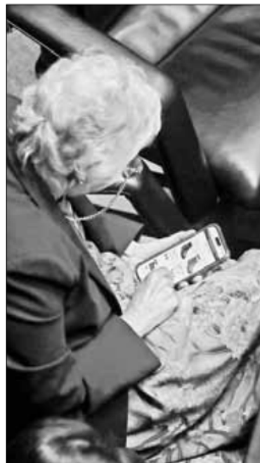
▲ La senadora Olga Sánchez Cordero informó que junto con varias funcionarias y legisladoras elabora un "plan nacional de gobierno" para Claudia Sheinbaum. La imagen, durante la sesión de ayer en el Senado.