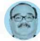
JORGE CARLOS RAMÍREZ MARÍN

► Y a propósito del Edomex, ayer, el Senado le otorgó licencia a Higinio Martínez para separarse del cargo por tiempo indefinido, por lo que se prevé que rinda protesta como Jefe de Gabinete y Proyectos Especiales. Gran tarea, precisamente porque los proyectos especiales marcarán el sexenio de la maestra Delfina .