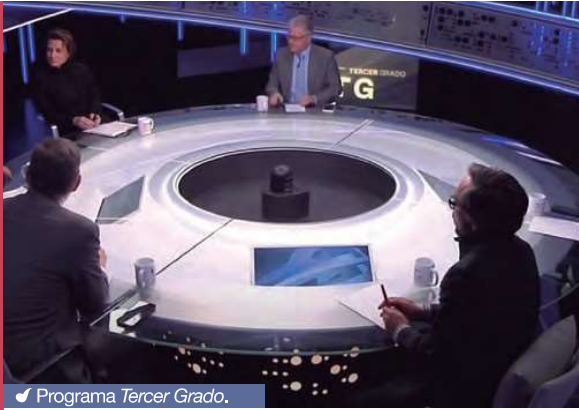
Programa Tercer Grado.