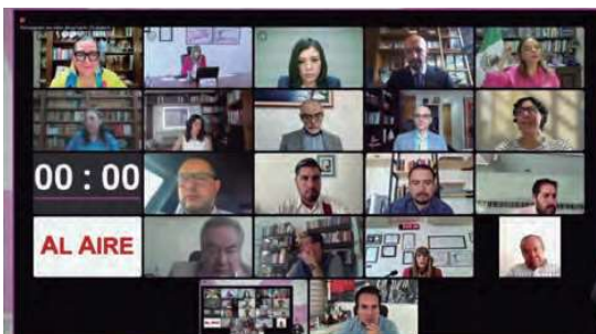
✓ El 7 de julio de 2023, el Consejo General del INE aprobó la metodología y el catálogo que serán usados para el monitoreo de programas de radio y televisión que difunden noticias en precampañas y campañas de las elecciones en México de 2024.

Esa decisión polémica se debatía en cada proceso electoral. Pero prevaleció una y otra vez el monitoreo incompleto (en sintonía con la postura de las empresas de radio y televisión), así se presentaba en la misma bolsa de tiempo cuánto se habló