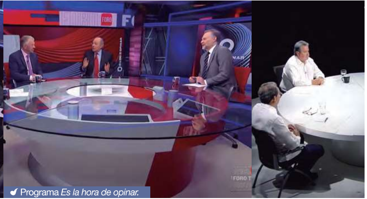
Programa Es la hora de opinar.