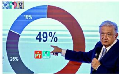
Pese a la prohibición del INE, el Presidente mostró encuestas que benefician a Morena y sus aliados rumbo a 2024.

"El martes conocí de otra encuesta que salió publicada en el periódico El País, de España. No lo digo yo. 'Si las elecciones para elegir Presidente fueran el día de hoy, ¿usted por cuál partido votaría?' Morena, preferencia bruta, 54; preferencia efectiva, 60 por ciento. PAN, preferen-