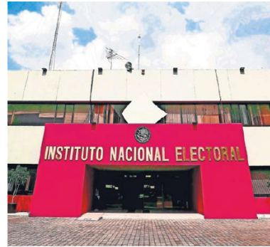
Este día se somete a votación de los consejeros el proyecto de los lineamientos de los gastos.

Los lineamientos establecen que la propaganda sobre los procesos internos podrá colocarse o fijarse en inmuebles de propiedad privada, siempre que medie permiso escrito del propietario. Sin embargo, no podrá colocarse en elementos del equipamiento urbano, carretero ni ferroviario; tampoco en monumentos ni edificios públicos.