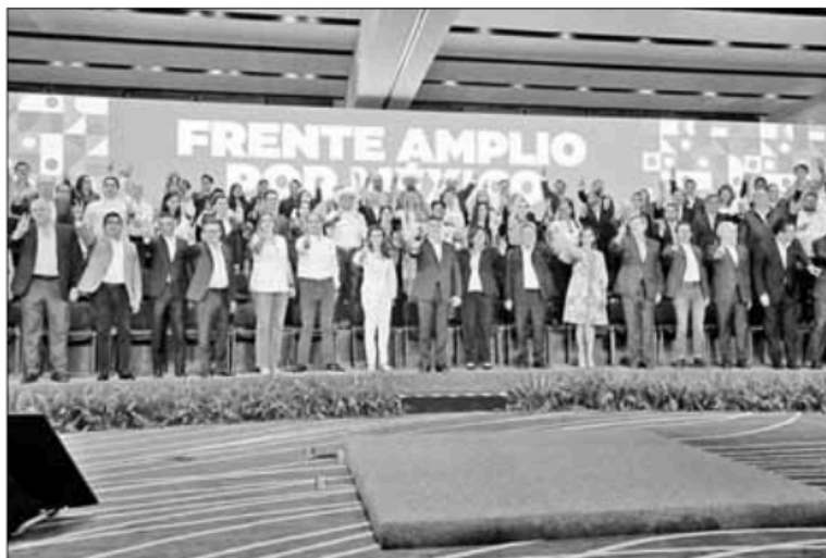
▲ Ayer fue la presentación oficial, en el hotel Hilton, de Reforma, de la propuesta para

DIAGNÓSTICOS DE CRÍTICA ruda, pero desfondados si son dichos por el responsable Alito y su intento de excusa: los índices de lo peor del pasado (pripanista) no son tanto ante lo peor del presente; el chuchismo residual esbozando algo sobre la izquierda y la secretaria general de lo que queda del PRD con el puño zurdo en alto como testimonio escénico de nada; Marko Cortés en el mismo plan de baja densidad intelectual que otros de sus compañeros de retórica, con Vicente Fox y su sombrero vueltos al galope traicionero y entreguista; Claudio X., a un extremo de las filas premium , y la cartelera de aspirantes presidenciales en asientos sorteados, todo entre la convicción, la duda o la sospecha de que a fin de cuentas la clave está en el dinero y en la capacidad de movilización (¡priistas, al ataque!), a partir de lo cual se conformará el padrón que definirá una mitad del proceso, con la otra mitad, la de las encuestas, también bajo control de las cúpulas y los ejecutivos empresariales. ¡Hasta mañana!