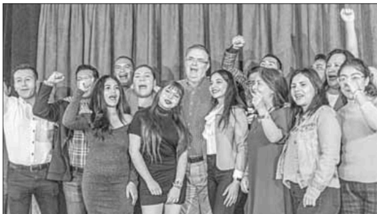
▲ Acompañado de simpatizantes, el ex canciller ofreció ayer una conferencia en un hotel al sur de

la CDMX, donde afirmó que sus recorridos son austeros y sin acarreo.