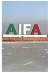
Más vehículos a seguridad

:::: Nos dicen que dentro de Palacio Nacional se comenta que tres altos funcionarios del gobierno federal, que buscan saltar a las de vehículos destinados para la seguridad interior y exterior de la terminal aérea. Nos detallan que los nuevos vehículos que sumarán las tareas de seguridad en el complejo aeroportuario son 22 camionetas pick-up, 15 radio patrullas tipo Sedan con equipamiento policial, cinco camiones de 6.5 toneladas, cuatro camionetas de 3.5 toneladas, dos ambulancias y dos autobuses tipo escolar. Nos hacen ver que, por mucho, habrá más vehículos en tierra que aviones en las pistas.