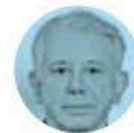
RAMÓN CASTRO CASTRO

► El exconsejero del Instituto Nacional Electoral (INE), Ciro Murayama , se defendió de los ataques en su contra luego de que anunció su regreso como profesor de la Universidad Nacional Autónoma de México (UNAM) en la Facultad de Economía. Asegura que distintos medios y voces están tratando de boicotear su reincorporación a la Máxima Casa de Estudios.