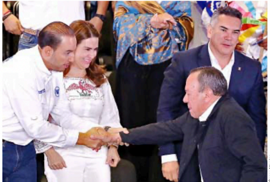
PROMOTORES. El dirigente panista Marko Cortés (izq.) saluda al líder del PRD, Jesús Zambrano. Junto a ellos Carolina Viggiano y Alejandro Moreno, dirigente del PRI.