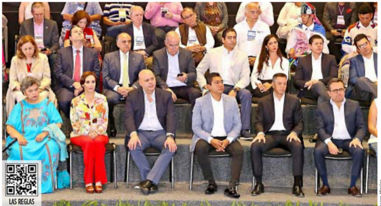
EN LA LISTA. Beatriz Paredes (izq. a der.), Lilly Téllez, Gustavo de Hoyos, Jorge Luis Preciado, Alejandro Murat e Ildefonso Guajardo también aspiran a contender en 2024.