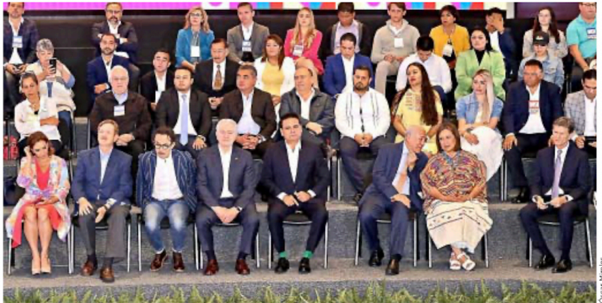
EN PRIMERA FILA. Ayer dieron un paso al frente Claudia Ruiz Massieu (izq. a der.), Juan Carlos Romero Hicks, Gabriel Quadri, Santiago Creel, Silvano Aureoles, José Ángel Gurría, Xóchitl Gálvez y Enrique de la Madrid.