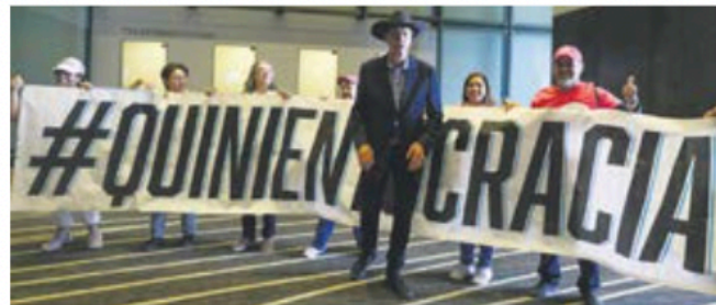
Acompaña. En el evento de la oposición estuvo presente el expresidente Vicente Fox.

Santiago Creel, José Ángel Gurría y Silvano Aureoles se dicen listos para inscribirse; Xóchitl y Téllez aún tienen inquietudes