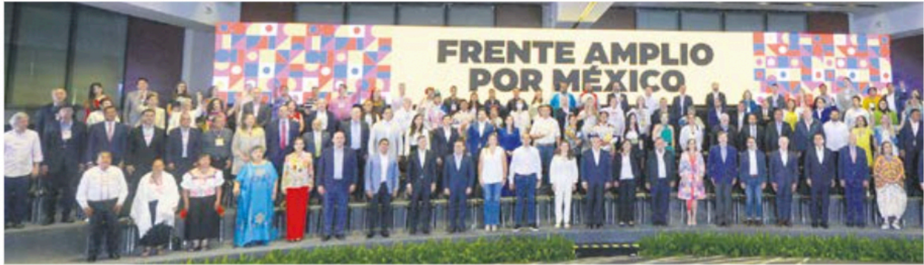
Unidos. Representantes de PAN, PRI, PRD y organizaciones civiles, ayer, durante la presentación del método para elegir al candidato presidencial de la oposición.

Bien acogido por los aspirantes, el método pactado por PAN, PRI, PRD y sociedad civil