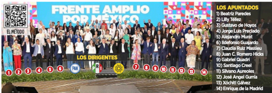
Los 14 aspirantes que serán parte del proceso para definir el 3 de septiembre próximo a su abanderado presidencial para 2024.

Preven dirigentes de partidos políticos tener abanderado el 3 de septiembre