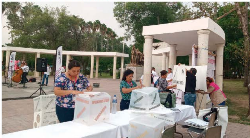
SIMULACRO DEL INE previo al día de la jornada electoral del 2 de junio organizado en Ciudad Victoria, Tamaulipas, ayer.

El recorte de la Cámara de Diputados al presupuesto del INE, por más de mil 400 millones de pesos, le obligó a suprimir proyectos y reducir hasta en 500 mdp lo que iba a gastar para organizar las elecciones de 2024.