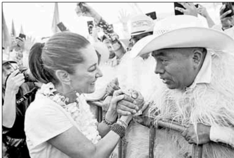
▲ Claudia Sheinbaum ayer durante un mitin de campaña en Chiapas.

LUEGO DE LA tragedia vivida en San Pedro Garza García (nueve muertos y decenas de heridos), donde colapsó el templete de un mitin de Movimiento Ciudadano al que asistía el candidato presidencial Álvarez Máynez, los vientos impactaron un acto de morenistas en Xonacatlán, estado de México, con un saldo de más de 50 heridos, aunque las primeras estimaciones oficiales aseguraban que ninguno en riesgo de muerte. Y, mientras la CNTE acepta lo negociado con el gobierno federal en cuanto a su pliego petitorio, y deja el Zócalo este miércoles para el cierre de campaña de Sheinbaum, o se mantiene ahí para tratar de conseguir algo más, ¡hasta mañana!