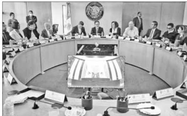
▲ Los consejeros del Instituto Nacional Electoral se reunieron ayer con integrantes